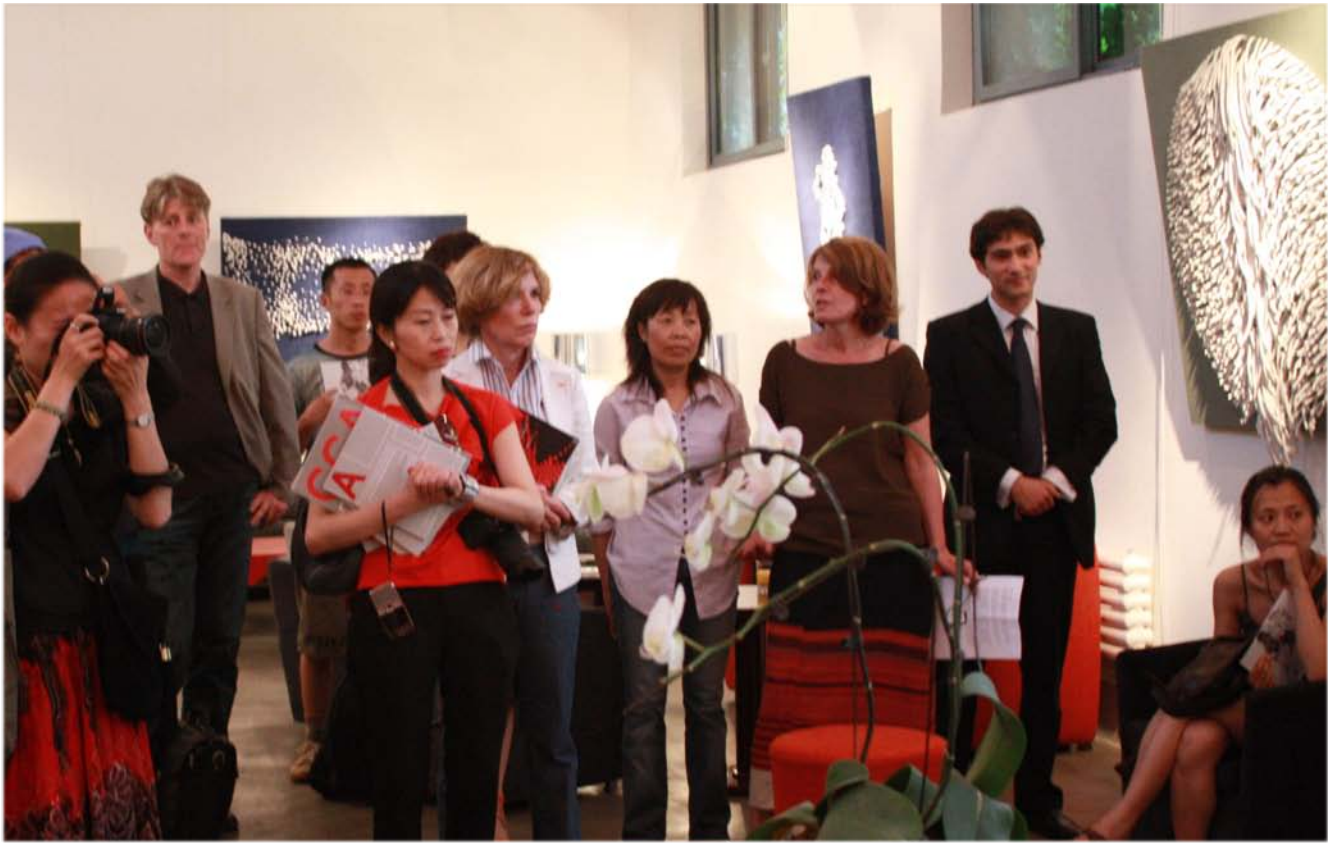
Vernissage de l'exposition Textile Dreams à Pékin (mai 2010)