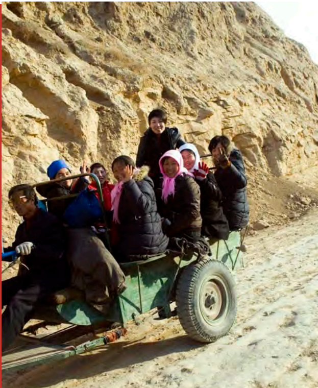
Fang (debout) au milieu des Fleurs et grand soleil sur paysage