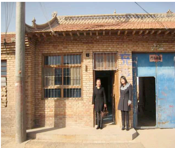
Bureau de Zhangjiayuan

En mars également, les Cent Fleurs se sont installées dans deux bureaux-ateliers, l'un à Liumiao et l'autre à Zhangjiayuan. Ces nouveaux lieux de travail leur permettent enfin d'avoir un lieu pour se réunir, broder ensemble ou se former les unes les autres. La location de ces deux bureaux a pu être financée par Femmes du Ningxia grâce au soutien de la Fondation RAJA - Danièle Marcovici.