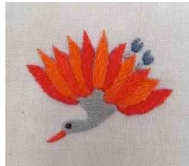
Xiao Niao - Oiseau - point lancé - Tang'Roulou ©

Pour plus d'infos, contactez Amélie : xiaofuxing@tangroulou.com