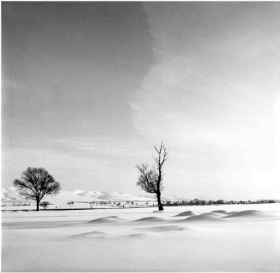
Paysage hivernal du Ningxia – Romain Bironneau

Comme annoncé dans le premier numéro de notre Lettre , Pierre-Yves, notre coordinateur des programmes, et Amélie, de Tang' RouLou (marque de vêtements et accessoires pour enfants, basée à Pékin), se sont rendus au Ningxia pour Noël.