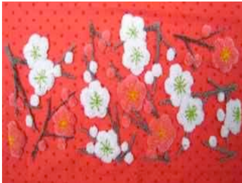
Sakura - Branches de cerisier – point mousse – Tang'Roulou ©